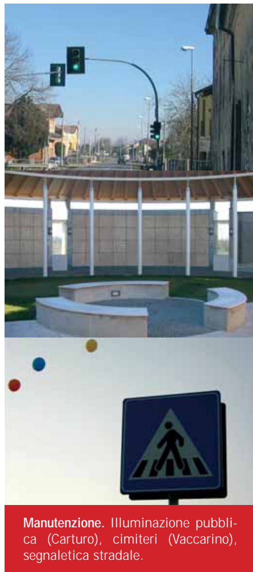
Manutenzione. Illuminazione pubblica (Carturo), cimiteri (Vaccarino), segnaletica stradale.

Una opportunità di sviluppo viene quindi offerta da Etra S.p.A, società presente nel territorio cui partecipano ormai 73 Comuni, che recentemente