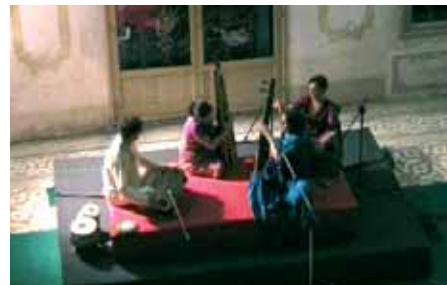
Musica. Troverà la sua dimensione più vera, dal vivo, in Villa Contarini.

Il viaggio di Giona: Operina realizzata dagli alunni dell'I.C. Belludi