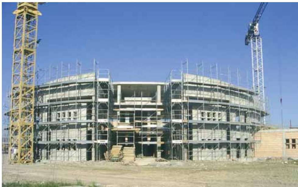
Lavori in corso. Il centro sportivo (sopra) sta diventando realtà; la ex scuola elementare "Negrelli" (sotto) tornerà all'antico splendore.

Pertanto il grande complesso coperto sta per essere definito "al grezzo", contestualmente proseguono i lavori esterni per il parco acquatico estivo con la definizione degli impianti della piscina esterna.